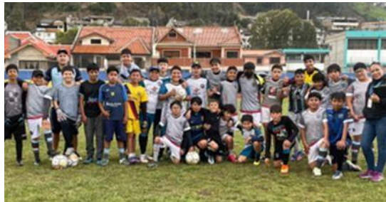
Ilustración 23 // Archivos CZ6