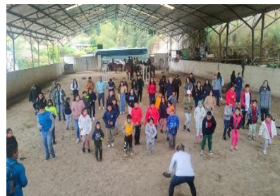
Ilustración 36 // Archivos CZ6

Esta actividad se realizó el 2 de agosto del 2023, con el fin de brindar un momento de recreación en los niños, en donde fueron participes de una bailo actividad, actividades recreativas, y montada en caballos.