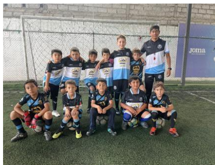
Ilustración 7 // Archivos CZ6