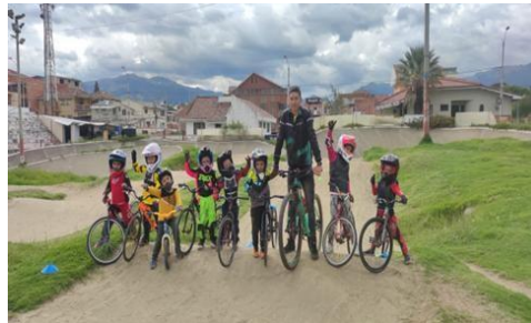
Ilustración 21 // Archivos CZ6