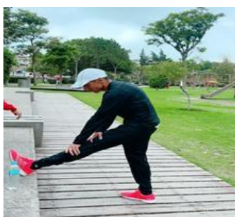
Ilustración 33 // Archivos CZ6