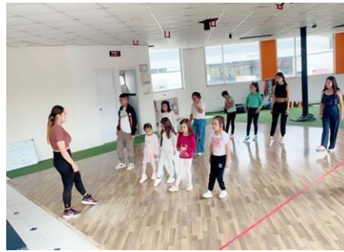
Ilustración 9