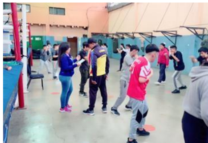
Ilustración 15 // Archivos CZ6