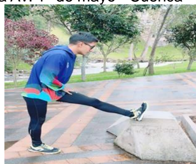
Ilustración 28

Lugar: Parque lineal de la Av. 1° de mayo - Cuenca