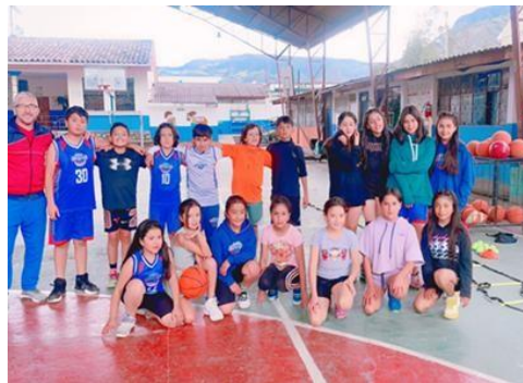
Ilustración 12