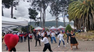
Ilustración 37

que se encontraban el sitio para terminar se concluyó con una bailo actividad dirigida a todos los presente.