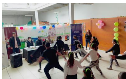
Ilustración 40: Activación Fundación Desarrollo Alianza