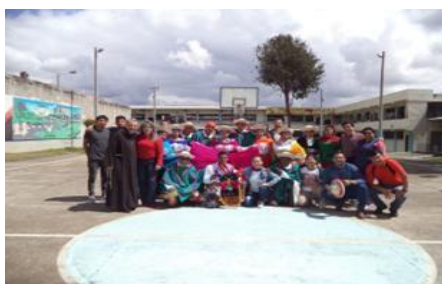
Ilustración 42: Activación Centro de Adolescentes Infractores (CAI)

APOYO FERIA POR EL DIA MUNCIAL DEL CORAZON