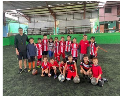
Ilustración 3 // Archivos CZ6