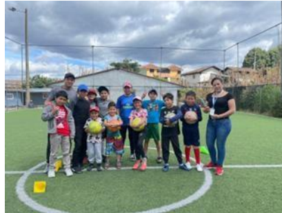
Ilustración 18 // Archivos CZ6