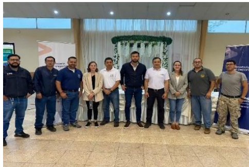
Ilustración 44: Evento Tu Mejor Abasto en Gualaceo

Se realizó el evento “Tu mejor abasto” a fin de crear conciencia en los conductores para evitar más accidentes de ciclistas en las vías, el mismo que tuvo lugar en las instalaciones del CEAR EP (Cuenca) el 1 de noviembre y se contó con la participación de 120 asistentes de colegios aledaños, así como de clubes de ciclismo que entrenan en los predios de la FDA, y la segunda ejecución tuvo lugar en el Sindicato de Choferes Profesionales de Gualaceo el 15 de noviembre y contamos con 100 usuarios de varios clubes de BMX del cantón y los alumnos Colegio del Sindicato de Choferes de Gualaceo.