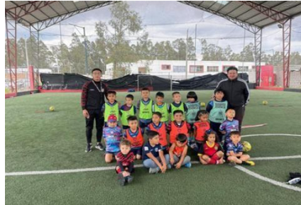
Ilustración 2 // Archivos CZ6