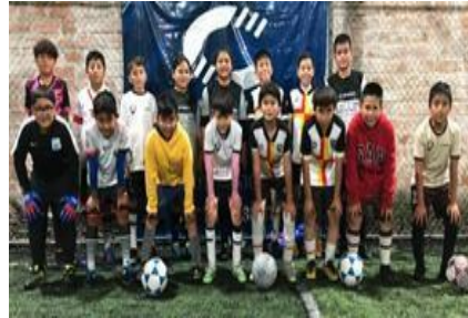
Ilustración 11