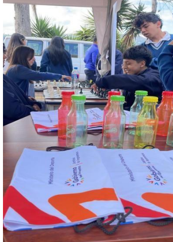
Ilustración 43 // Archivos CZ6

Lugar: Centro de salud Nro 1 ubicado en la Av. Huayna Capac