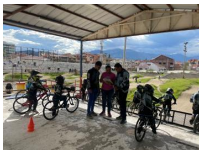
Ilustración 8 // Archivos CZ6