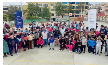
Ilustración 41 : Activación Orfanato Tadeo Torres / CZ6