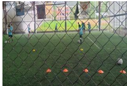
Ilustración 26