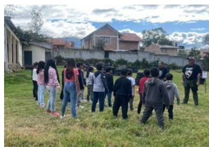
Ilustración 17 // Archivos CZ6