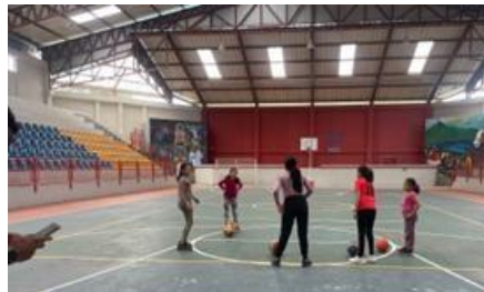
Ilustración 19 // Archivos CZ6