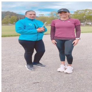
Ilustración 27 // Archivos CZ6