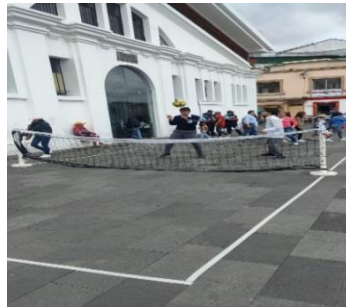
Ilustración 38 // Archivos CZ6

Esta actividad desarrollada por el ministerio de salud se dio el día 1 de diciembre del 2023 en el mercado 9 de octubre, en donde nos solicitaban apoyo para el manejo de actividades recreativas las cuales se les brindo el apoyo para este evento