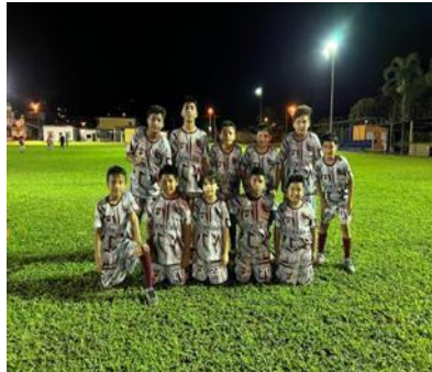
Ilustración 14 // Archivos CZ6