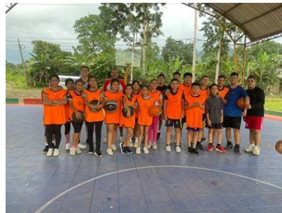
Ilustración 10 // Archivos CZ6