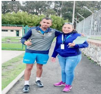
Ilustración 30 // Archivos CZ6

Lugar: Parque Virgen Del Milagro - Cuenca