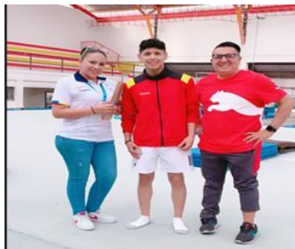
Ilustración 34 // Archivos CZ6