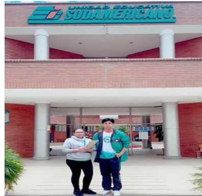
Ilustración 35 // Archivos CZ6