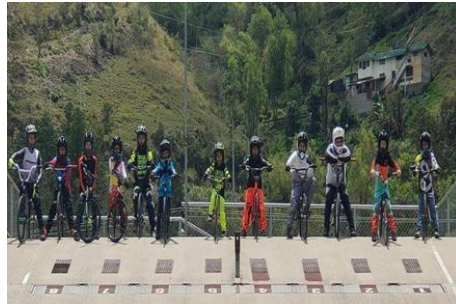
Ilustración 5 // Archivos CZ6