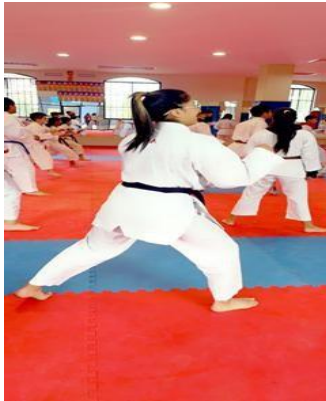
Ilustración 29 // Archivos CZ6

Lugar: Gimnasio de Karate de la FDA - Cuenca