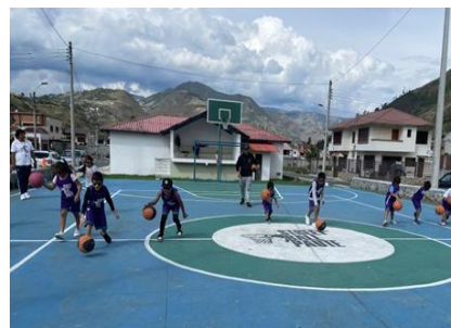
Ilustración 4 // Archivos CZ6