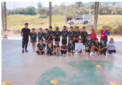
Ilustración 16 // Archivos CZ6