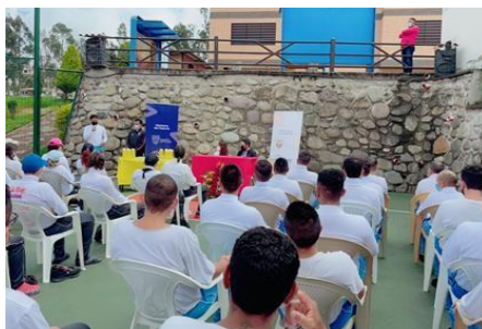
Ilustración 39: Activación Clínica 12 Pasos