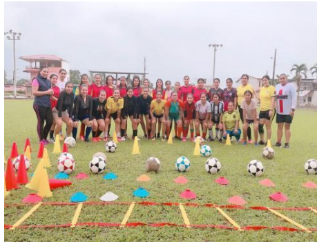
Ilustración 13 // Archivos CZ6