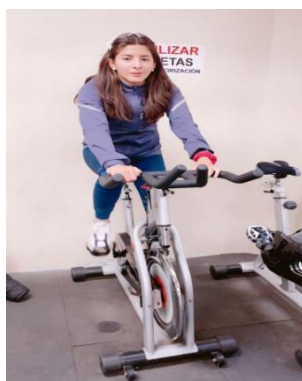
Ilustración 32