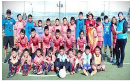
Ilustración 20 // Archivos CZ6