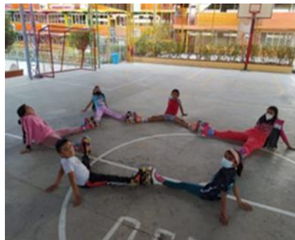
Ilustración 6 // Archivos CZ6