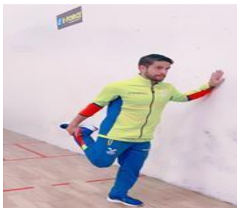
Ilustración 31 // Archivos CZ6