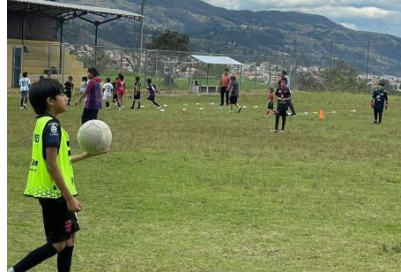
Ilustración 25 // Archivos CZ6