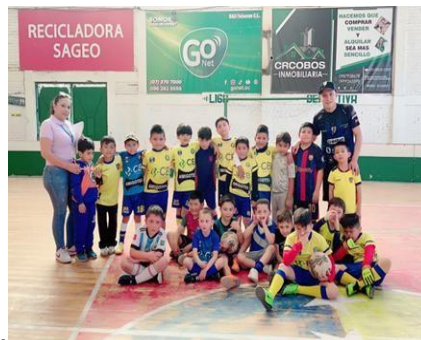
Ilustración 24 // Archivos CZ6