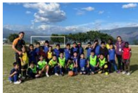
Ilustración 22 // Archivos CZ6