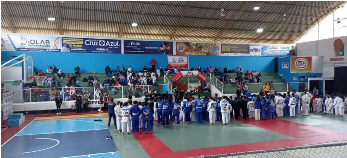
III Open Zonal de Judo Guano 2023 provincia de Chimborazo participación de 150 deportistas