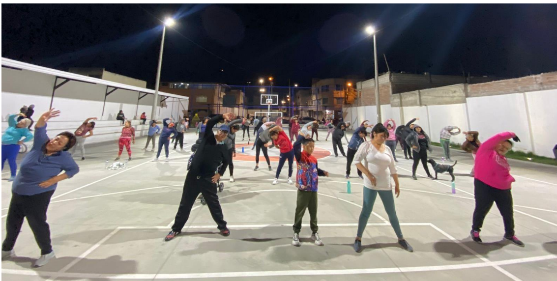
Beneficiarios del punto activo Servicio en el barrio Bonilla Abarca de la ciudad de Riobamba provincia de Chimborazo

El SERVICIO ACTÍVATE, se ejecutó en las provincias de Chimborazo, Cotopaxi, Tungurahua y Pastaza y tiene como uno de los fines realizar actividad física y recreativa para contrarrestar el sedentarismo e impulsar a realizar actividad física o actividades recreativas al menos de 60 minutos en el día, para su formación física óptima y que no tenga complicaciones en su salud. También este proyecto busca promover el buen uso del tiempo libre, involucrando en su accionar la atención a grupos de atención prioritaria (personas con discapacidad, personas con enfermedades catastróficas, adultos mayores y embarazadas); así como también a grupos vulnerables (personas privados de la libertad, niños, niñas y adolescentes en riesgo).