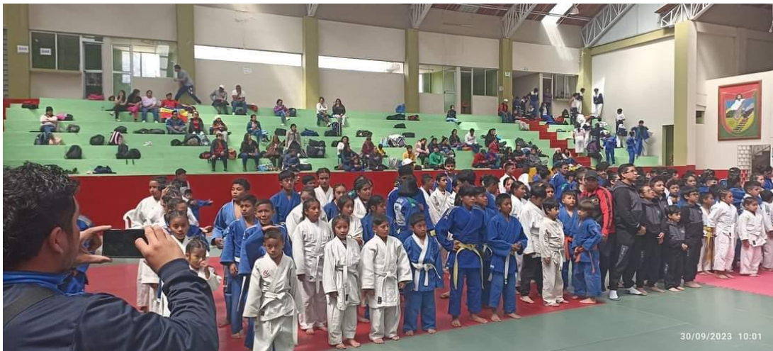
IV Open Zonal de Judo Guamote 2023 provincia de Chimborazo participación de 200 deportistas