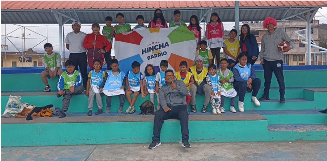
Activación Barrio el Chibunga de la ciudad de Riobamba provincia de Chimborazo con los beneficiarios del Servicio Hincha de mi Barrio

presidentes de los diferentes Barrios, se estableció una mecánica la cual permitió promover la práctica del fútbol basada en principios, la cual se activó en 478 puntos activos.