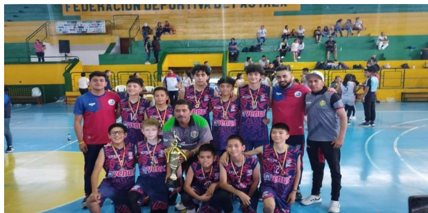
Torneo Zonal Estudiantil de Baloncesto Gloria Pico Puyo 2023 provincia de Pastaza