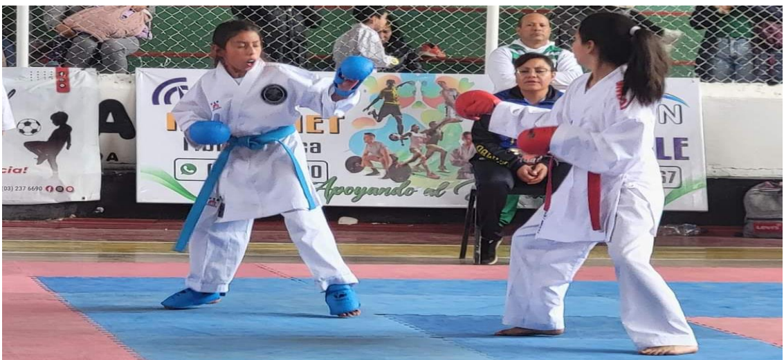
IV Open Zonal de karate do Pujilí 2023 provincia de Cotopaxi participación de 210 deportistas