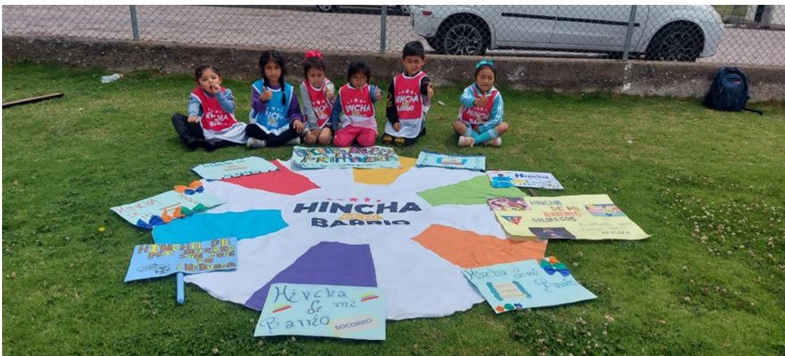
Niños beneficiarios del punto activo Servicio Hincha de Mi Barrio en la Primavera de la ciudad de Riobamba provincia de Chimborazo

Se contó con 9490 beneficiarios entre niños y niñas, y 13 adolescentes, con los cuales se realizan las sesiones socio deportivas en los horarios establecidos de lunes a viernes. Este servicio promueve los principios establecidos como son la empatía, disciplina, respeto, juego limpio, y confianza.