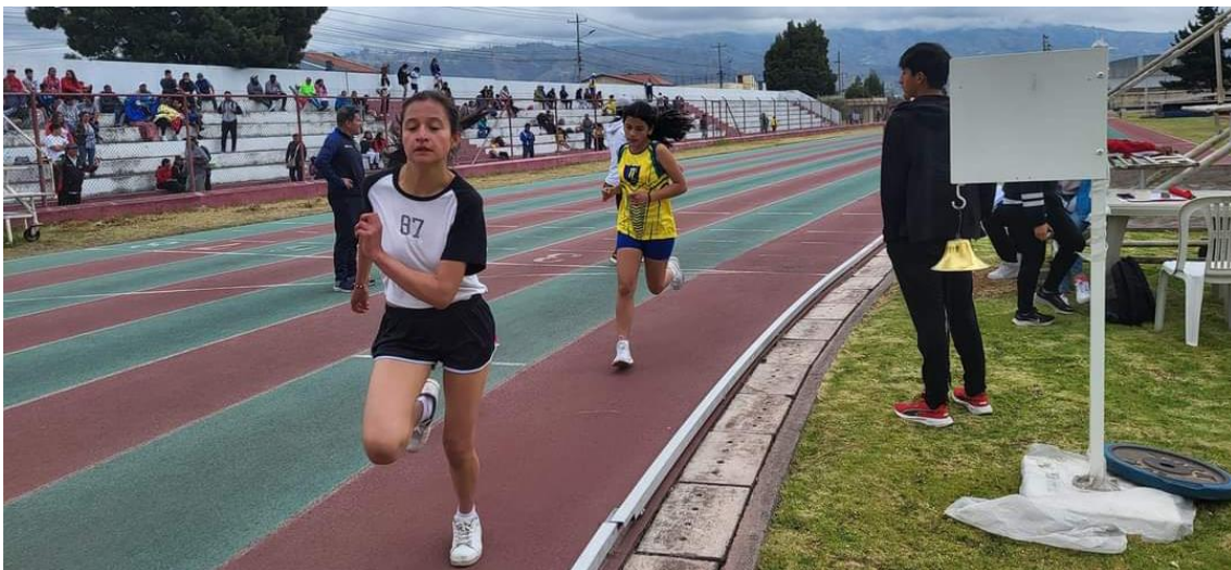
II Open Zonal de Atletismo Ambato 2023 provincia de Tungurahua participación de 200 deportistas