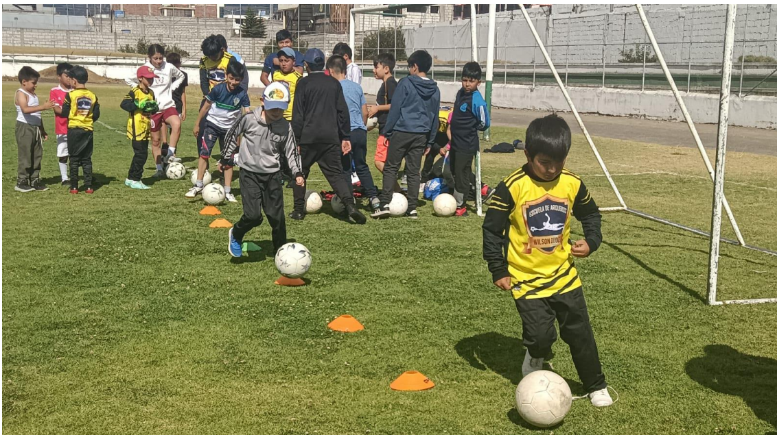
Inspecciones Técnico – Metodológicas a los Clubes Especializados Formativos de las provincias de Chimborazo, Tungurahua, Pastaza y Cotopaxi.