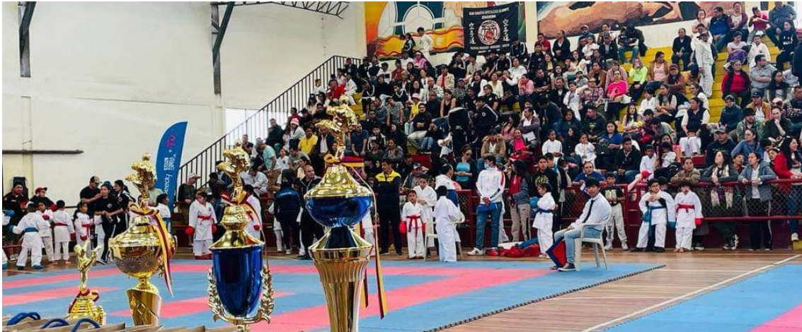
IV Open Zonal de karate do Pujilí 2023 provincia de Cotopaxi participación de 210 deportistas