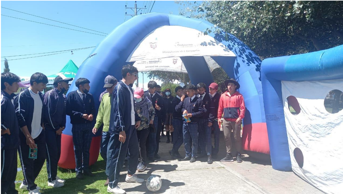
Participación en las distintas Ferias de la Infancia en las provincias de Chimborazo, Tungurahua, Pastaza y Cotopaxi.