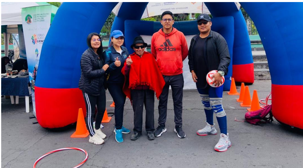
Participación en las distintas Ferias de la Infancia en las provincias de Chimborazo, Tungurahua, Pastaza y Cotopaxi.