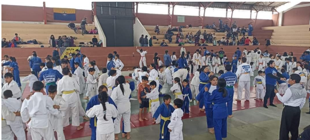
II Open Zonal de Judo Chambo 2023 provincia de Chimborazo participación de 200 deportistas