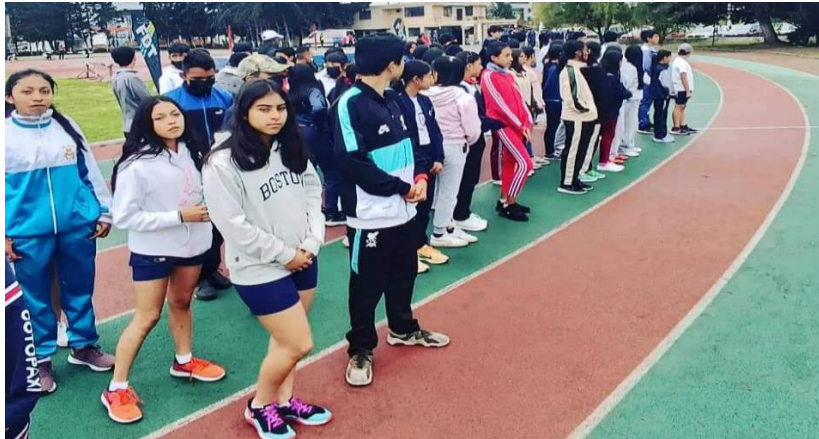
Torneo Zonal Estudiantil de Atletismo Néstor Quinapanta Ambato 2023 provincia de Tungurahua