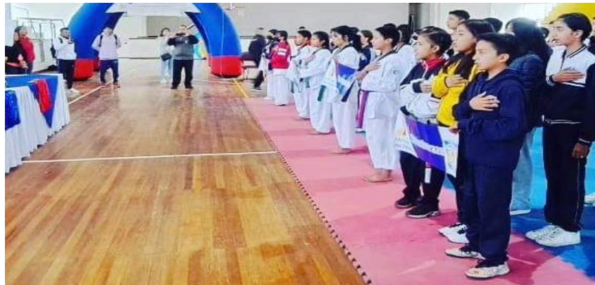
II Torneo Zonal Estudiantil de taekwondo Enrique Suarez Pujilí 2023 provincia de Cotopaxi

Fuente y elaboración: Ministerio del Deporte / Oficina Técnica Zonal 3