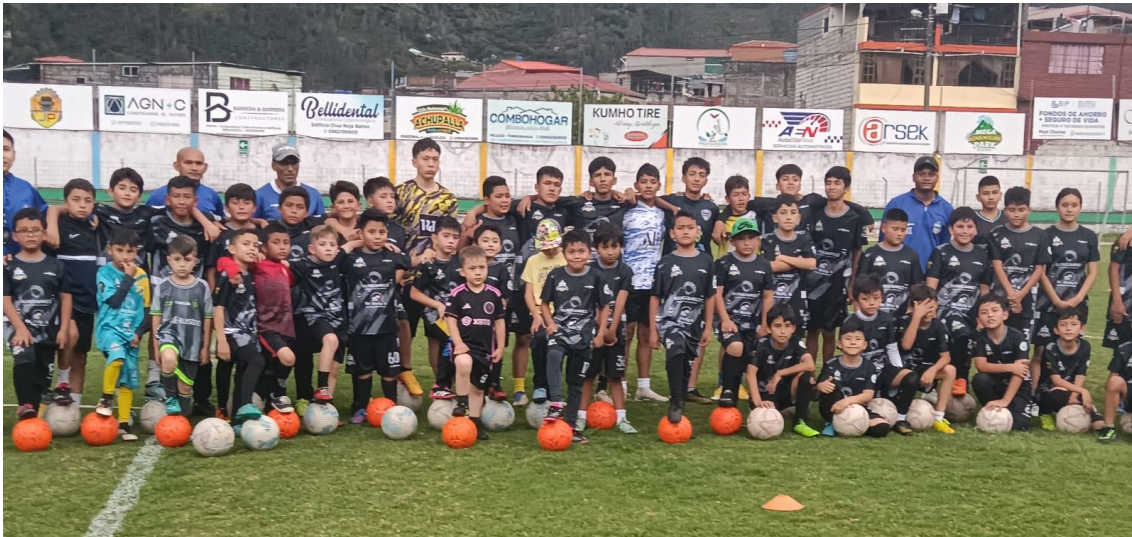
Inspecciones Técnico – Metodológicas a los Clubes Especializados Formativos de las provincias de Chimborazo, Tungurahua, Pastaza y Cotopaxi.