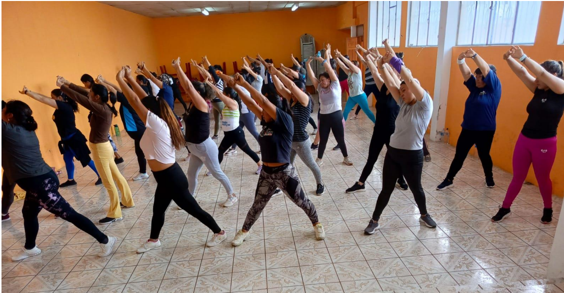
Grupo de Beneficiarios del Punto activo buena esperanza provincia Cotopaxi cantón Pujilí