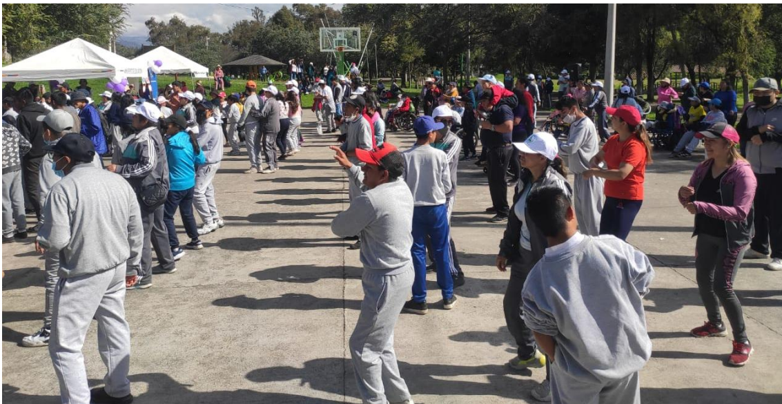
Grupo de beneficiarios del punto activo Servicio Actívate de la ciudad de Ambato provincia de Tungurahua