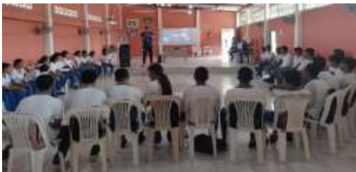
Unidad Educativa Fiscal Bellavista