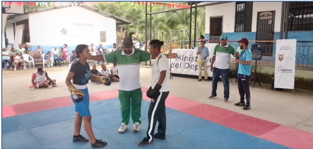
Imagen Nro. 04

Exhibición deportiva de Boxeo - UE de Educación Especializada "Giomar Vera Ramírez"