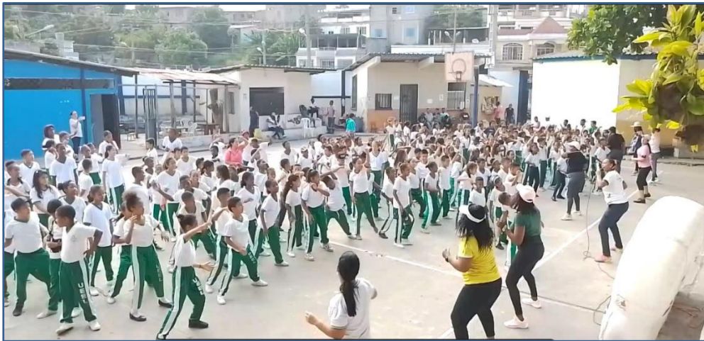
Imagen Nro. 02