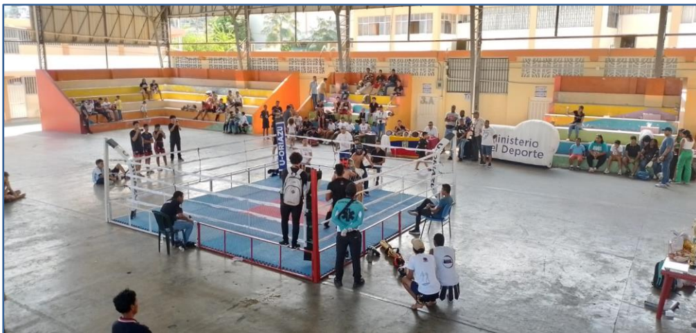
Imagen Nro. 08

Taller: Transferencia de Metodología de la Iniciativa “SOMOS EQUIDAD” - Complejo SAN RAFAEL