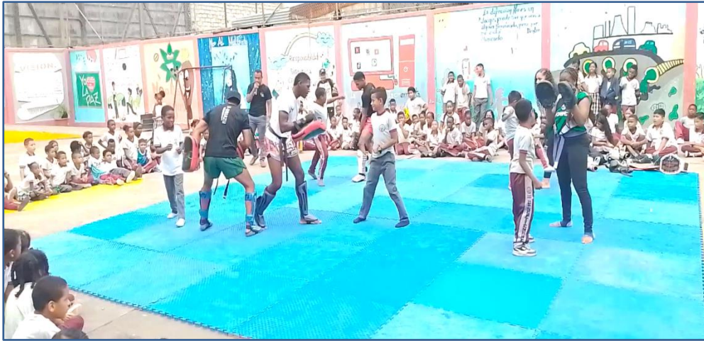
Imagen Nro. 01

Exhibición deportiva de Kick Boxing - UE "21 de Septiembre"