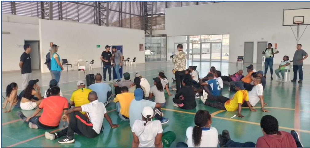
Imagen Nro. 07

Taller: Transferencia de Metodología de la Iniciativa “SOMOS EQUIDAD” - Complejo SAN RAFAEL