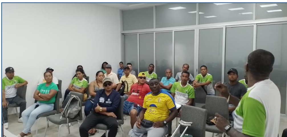
Imagen Nro. 06