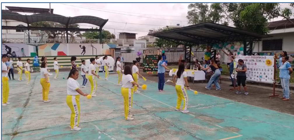
Imagen Nro. 09

Torneo Nacional de Kick Boxing - UE “Sagrado Corazón”