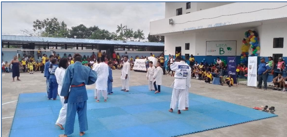
Imagen Nro. 03