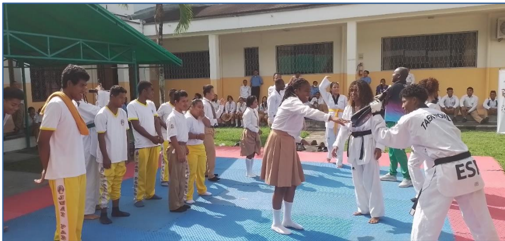
Imagen Nro. 05